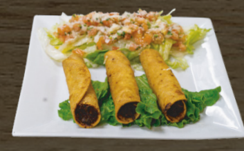
6. FLAUTAS FRIED TACOS $7.50/ $1.00/CU