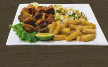
8. YUCA Y CHICHARON YUCA W/FRIED PORK $10.00