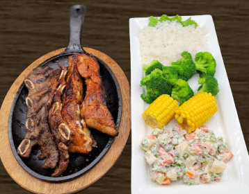
56. PARRILLADA ESPECIAL $30.00