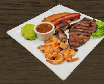
51. PLATO TÍPICO $25.00