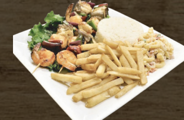
39. PINCHOS MIXTOS SKEWERS CARNE Y POLLO/CHICKEN & BEEF $16.00