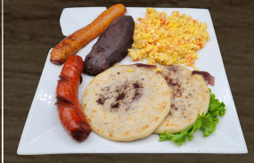
17. DESAYUNO SALVADOREÑO SALVADOREAN BREAKFAST $13.00