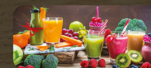
Fruit Bar Bar de Frutas