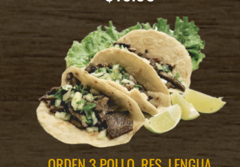
ORDEN 3 POLLO, RES, LENGUA CHICKEN, BEEF & TONGE