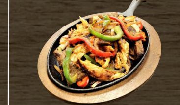
MIXTA, POLLO O RES MIXED, CHICKEN OR BEEF