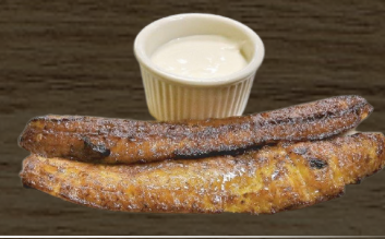
3. PLATANO FRITO FRIED PLANTAIN $4.00