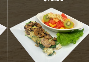
27. OMELETTE LIGHT $10.00