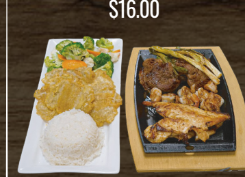
49. MAR Y TIERRA SURF & TURF $16.00