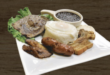
33. BANDEJA PAISA COLOMBIAN PLATE $17.00