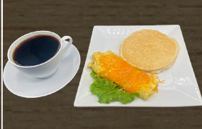
25. DESAYUNO COMBO $12.00