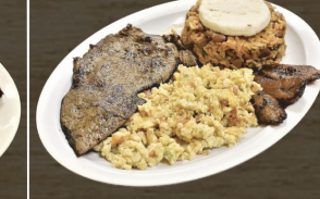
23. CALENTADO $11.00