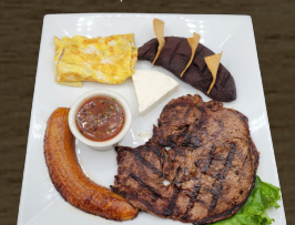
31. DESAYUNO DE LA CASA $13.00