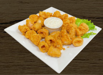
11. CALAMARES FRITOS FRIED CALAMARI $8.00