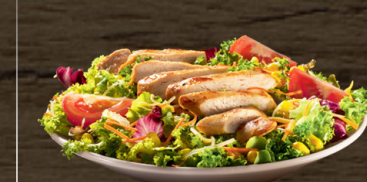
POLLO, CARNE O MIXTA/ CHICKEN, BEEF OR MIXED