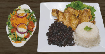
ASADA O EMPANIZADA CHICKEN BREAT GRILLED OR BREADED