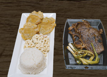
48. BISTEK A LO POBRE $13.00