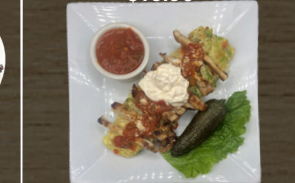
24. OMELETTE DE POLLO CHICKEN OMELETTE $10.00