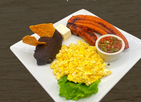
26. DESAYUNO CAMPESTRE $12.00