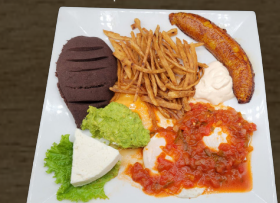
32. DESAYUNO RETALTECO $12.00