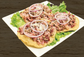
CARNE O POLLO / BEEF OR CHICKEN