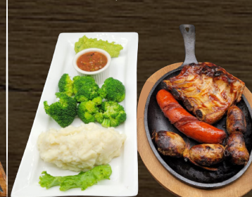
55. PARRILLADA DE LA CASA $30.00