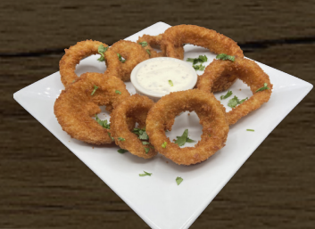
12. AROS DE CEBOLLA ONION RINGS $8.00