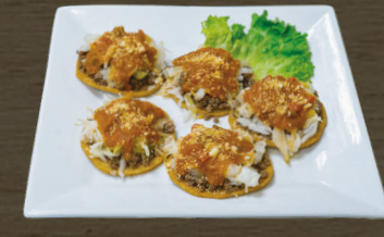
9. GARNACHAS BEEF GARNACHAS $10.00