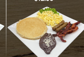
28. DESAYUNO EJECUTIVO $12.00