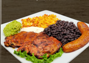
29. DESAYUNO QUETSALTECO $13.00