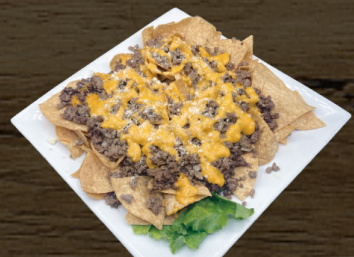
10. NACHOS CON CARNE BEEF NACHOS $10.00