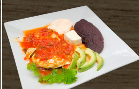
21. DESAYUNO REGULAR REGULAR BREAKFAST $10.00