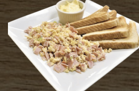
14. DESAYUNO DELICIAS DELICIAS BREAKFAST $7.00