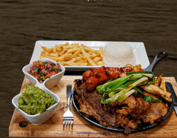
54. PARRILLADA CHAPINA $35.00