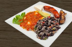
18. DESAYUNO RANCHERO RANCHERO BREAKFAST $13.00