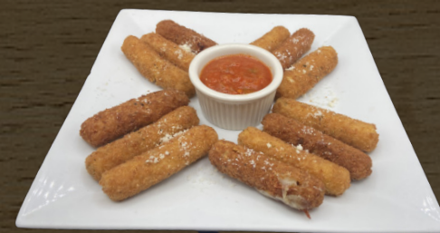
13. MOZZARELLA STICKS $10.00