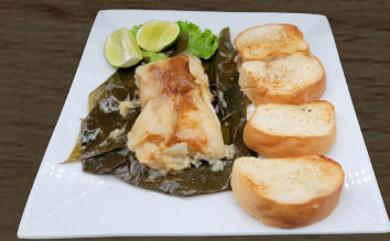
5. TAMAL DE POLLO/CERDO CHICKEN/PORK TAMAL $4.00