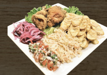
36. POLLO CON TAJADAS CHICKEN W/FRIED PLANTAINS $11.00