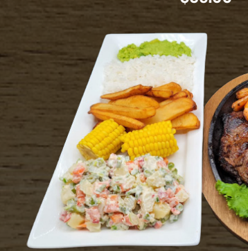
57. PARRILLADA COSTEÑA $35.00