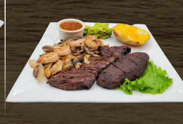
52. ENTRAÑA CON CAMARONES Y CHAMPIÑONES $35.00