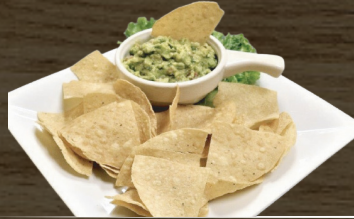
1. NACHOS GUACAMOLE NACHO W/GUACAMOLE $8.00