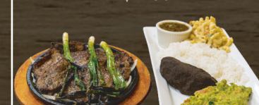
41. CHURRASCO CHAPIN CHAPIN STEAK $17.00