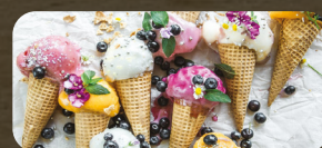
Ice Cream Helados

*ACOMPAÑANTES: ARROZ, TOSTONES, FRIJOLES, ENSALADA, PLÁTANO FRITO, AGUACATE VEGETALES, PAPAS FRITAS, CASAMIENTO, TAJADAS, YUCA FRITA Y GUACAMOLE