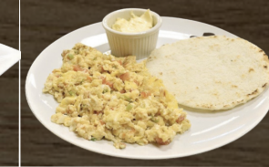
16. DESAYUNO COLOMBIANO COLOMBIAN BREAKFAST $6.00