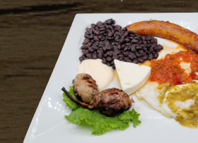
30. DESAYUNO GRANJERO $13.00