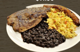
22. DESAYUNO GUATEMALTECO GUATEMALAN BREAKFAST $11.00