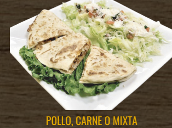
POLLO, CARNE O MIXTA/ CHICKEN, BEEF OR MIXED