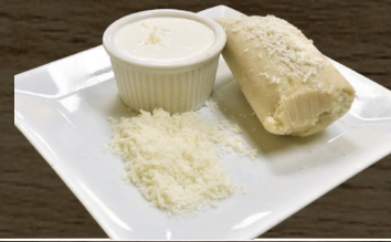
2. TAMAL DE ELOTE CORN TAMAL $4.00