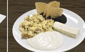
19. DESAYUNO NORMAL NORMAL BREAKFAST $8.00