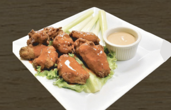
7. ALITAS PICANTES CHICKEN WINGS $8.00