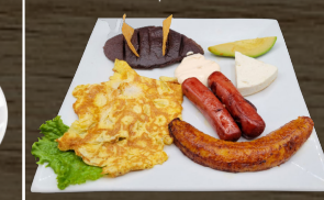
20. DESAYUNO CONTINENTAL CONTINENTAL BREAKFAST $14.00