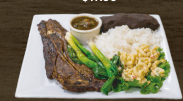
42. CHULETA DE RES BEEF CHOP $17.00