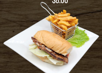
50. HAMBURGESA HAMBURGER $8.00